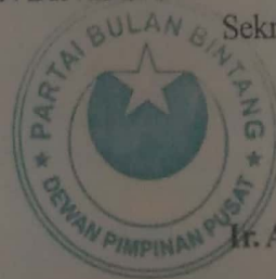
Prof. Dr. Yusril Ihza Mahendra, SH.